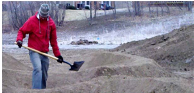
2) Handarbeit gefordert

Die Aufforderung zur persönlichen Unterstützung mit Pickel und Schaufel wird ebenfalls mit einem Infoblatt des Bikepark am See erfolgen.